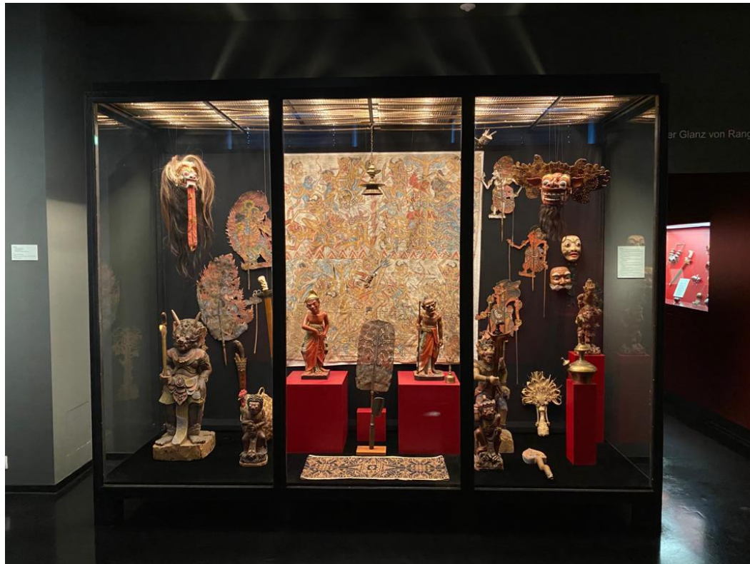
Teile der alten Dauerausstellung