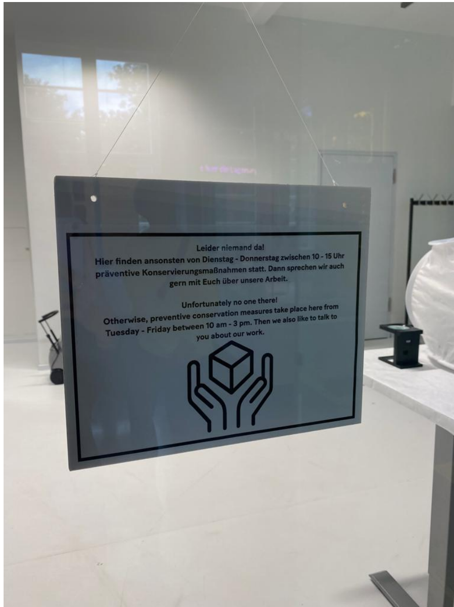
Care Room mit Hinweis zu den Arbeitszeiten