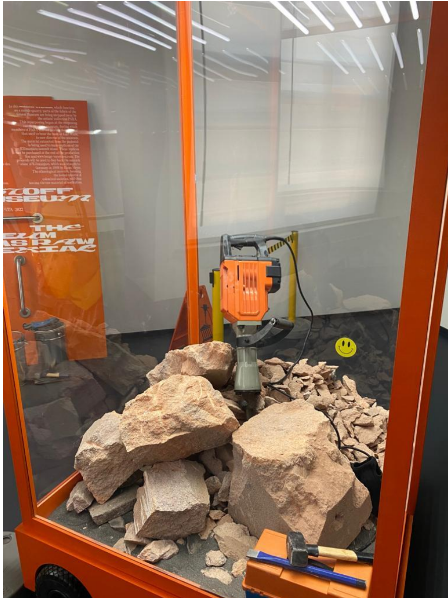
Überreste der Ehrenstelle

das sollte sie auch. Die Künstler*innen zeigten damit Ungleichheiten hinsichtlich moralischer Bewertungen auf: Empörung über den Vandalismus an einer nicht denkmalgeschützten Säule auf der einen und das Unrecht, welches die Museumssammlungen mit sich tragen, auf der anderen Seite.