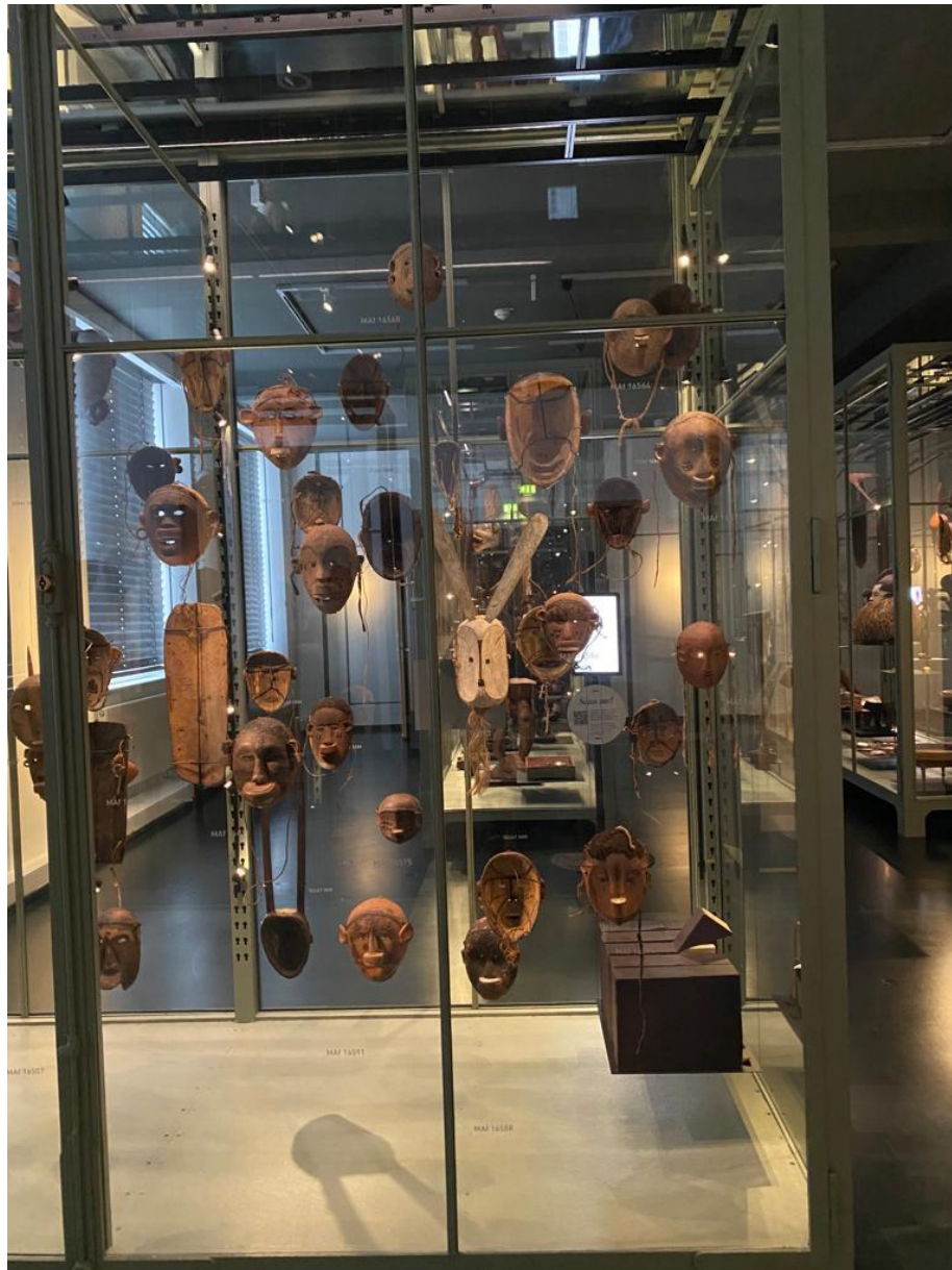
Sammlung von Masken aus dem heutigen Tansania