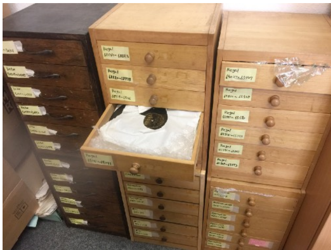
Regale mit Schellackplatten aus der Kataoka-Sammlung