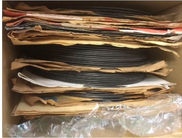
Schellackplatten aus der Kataoka-Sammlung

Eine weltweit einmalige Sammlung von rund 3.850 kommerziellen Schellackplatten japanischer Herkunft von 1915 bis 1950 hauptsächlich aus der Film- und Unterhaltungskultur Japans soll auditiv und visuell digitalisiert und weltweit zugänglich gemacht werden. Die Sammlung stellt ein einzigartiges Archiv der frühen Kulturwirtschaft ( Contents Business ) dar und ermöglicht die wissenschaftliche Beschäftigung mit zahlreichen Aspekten der Medien-, Technik-, Sprach- und Kulturgeschichte Japans im globalen Kontext.